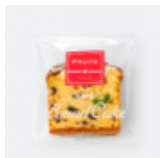
パウンドケーキ フルーツ