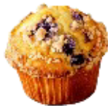
ブルーベリー & クランブルマフィン