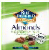
ブルーダイヤモンド わさび