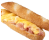
バゲットサンドイッチ (ハム & チーズ)