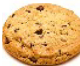
チョコチップ クッキー