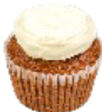
キャロット カップケーキ