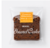
パウンドケーキ チョコレートオレンジ