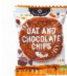
グルテンフリークッキー (チョコ)